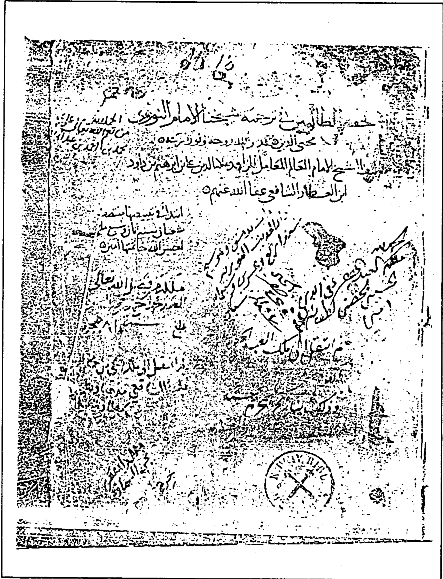
صورة عن طرة النسخة المعتمدة في التحقيق